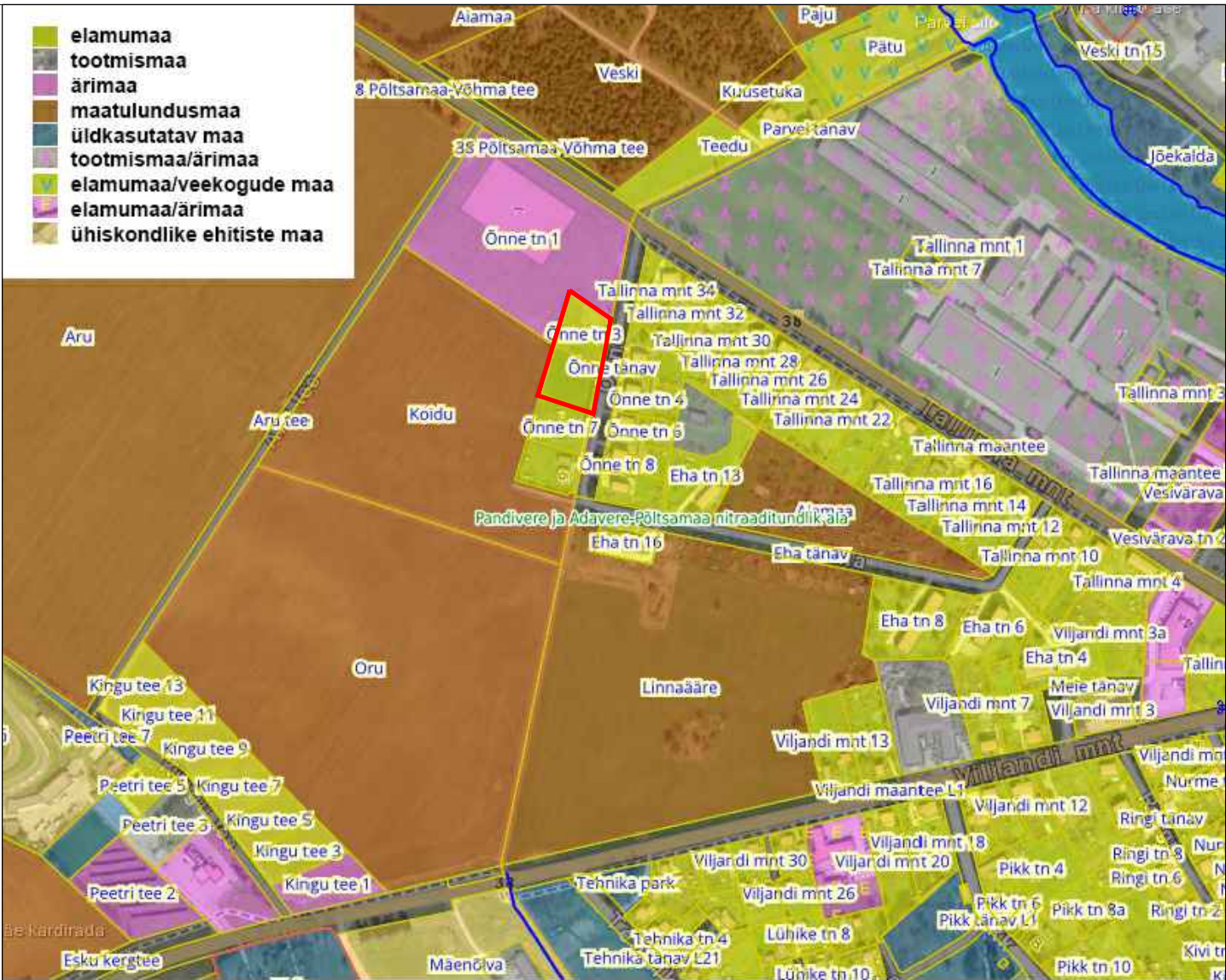
Kontaktvööndi olemasolevad maaüksuste sihtotstarbed